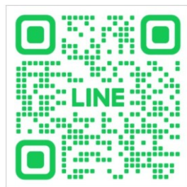
Line 專線QR code